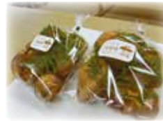
岡田亥早夫『原木生しいたけ』