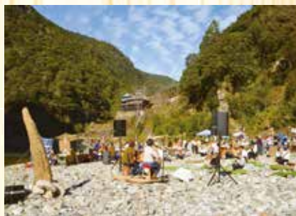
← 静峡で企画・運営を行なった音楽フェスティバル

私が十津川村に来て3年が経ち、地域おこし協力隊としての任期満了を迎えました。 3年間、十津川木工家具協議会で十津川村の木材を使った家具の制作や新製品のデザイン・開発・PRに加え、自分自身のオリジナル家具の開発をしてきました。任期満了後も変わらず、山崎の加工場で活動していきます。 任期中は、たくさんの人に大変お世話になりました。ありがとうございました。 今後の活動を通じて恩返ししたいと思っております。今後ともよろしくお願いたします。