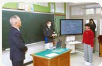
十津川第一小学校の様子