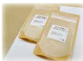
岡田亥早夫『しいたけ粉』