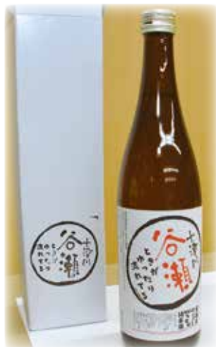
谷瀬地域受入協議会 「日本酒 谷瀬」