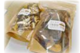
岡田亥早夫 『原木乾燥しいたけ』