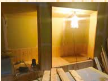
改修中の空き家(竹筒)→