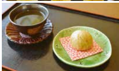
冬のお茶菓子として提供。